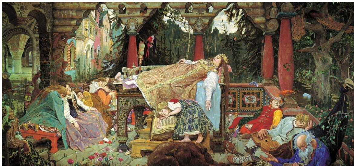
В.М.Васнецов «Спящая царевна»

детей знакомят с жизнью и творчеством таких художников – сказочников как В.М. Васнецов, И.Я. Билибин, Н.К. Рерих и других.