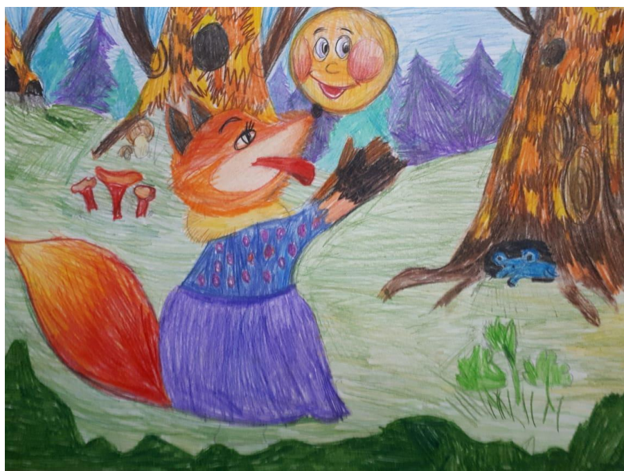
Трунян Артём, 8 лет Иллюстрация к сказке "Колобок" Цветной карандаш