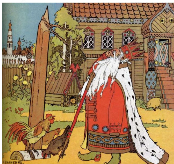
И.Я. Билибин. Иллюстрации к сказкам

Когда учащиеся получают задание по живописи выполнить пейзаж, они с увлечением занимаются этой работой. Они знают, что почти каждый пейзаж может быть использован как среда в жанровой композиции и выполняют большее количество работ, нежели было поручено. Для подготовки к сказочной теме очень помогают зарисовки, выполненные во время пленера. Так как помимо пейзажных зарисовок, дети много рисуют животных. В русских сказках часто главную роль играет одно или несколько животных. А во время