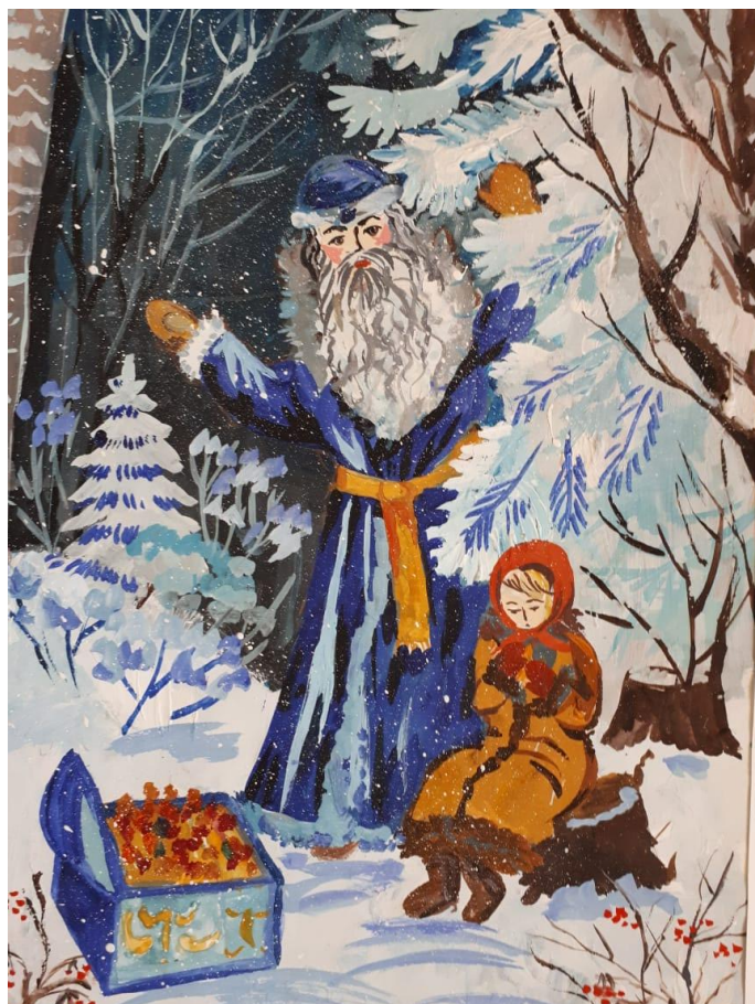
Коротынов Дима, 8 лет Иллюстрация к сказке "Морозко" Гуашь