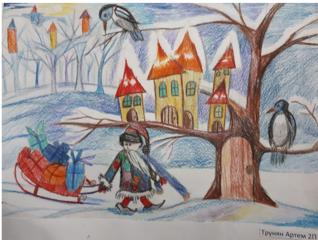
Трунян Артём, 8 лет По сюжетам народных сказки "Мальчик-с-пальчик" Цветной карандаш