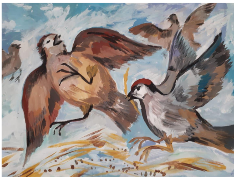
Шардин Тимофей По сюжету сказки "Три зёрнышка" Гуашь