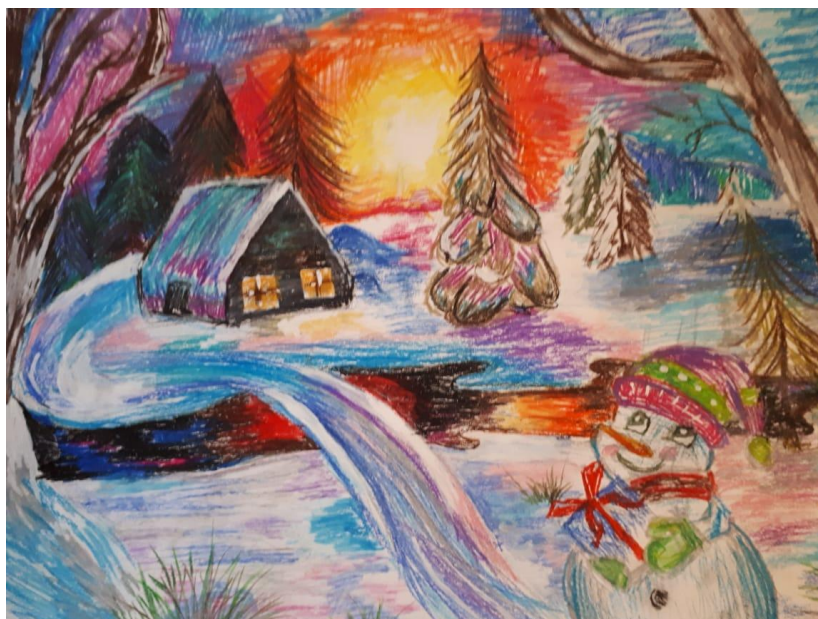
Потапова Дарья, 12 лет Иллюстрация к сказке "Под Новый Год" Масленая постель