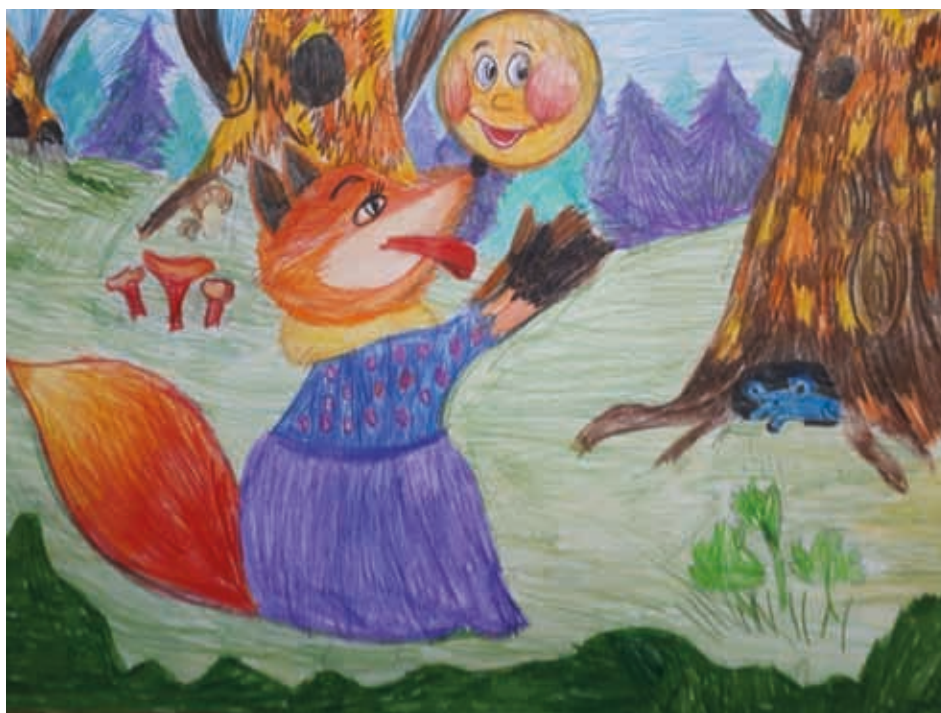
Трунян Артём, 8 лет Иллюстрация к сказке «Колобок» Цветной карандаш