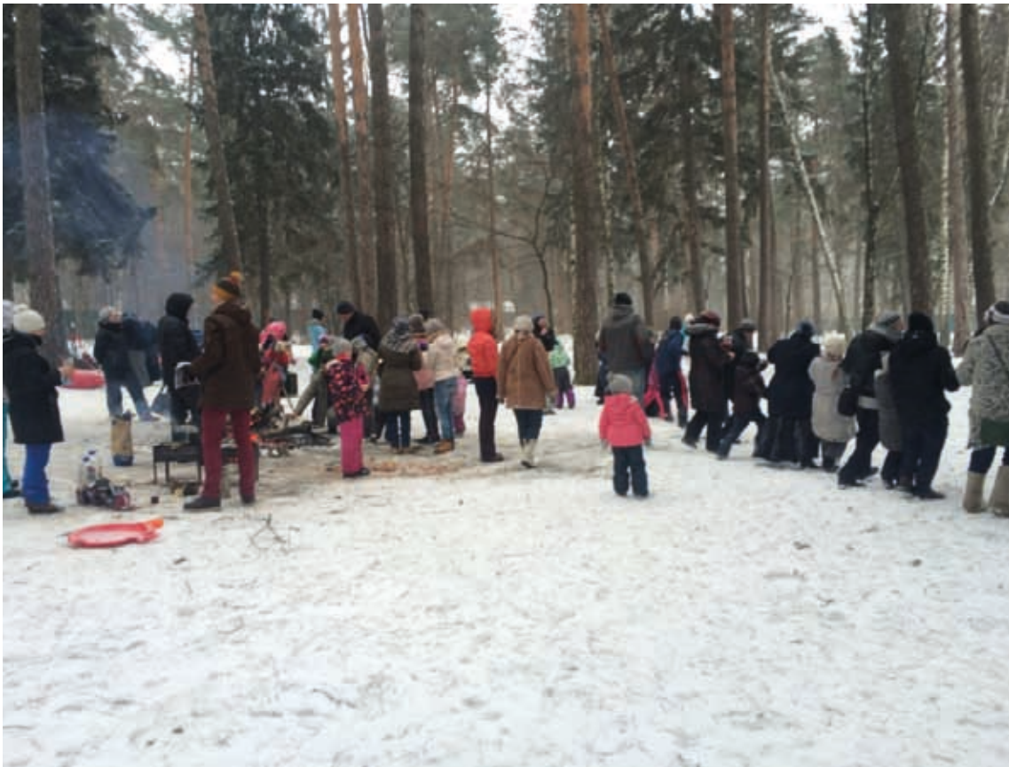
Семейные выезды на природу