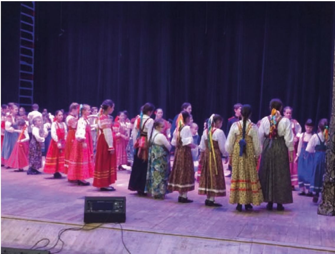
Вечёрка с фольклорным коллективом «Дорога» и «Крутуха»