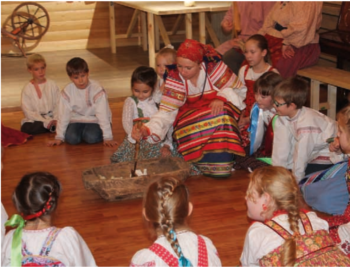
Праздник «Капустные посиделки»