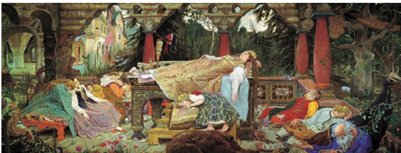
В.М.Васнецов «Спящая царевна»

На примере этой темы очень хорошо видна взаимосвязь таких предметов как композиция, живопись и история искусств. На предмете история искусств детей знакомят с жизнью и творчеством таких художников – сказочников как В.М. Васнецов, И.Я. Билибин, Н.К. Рерих и других.