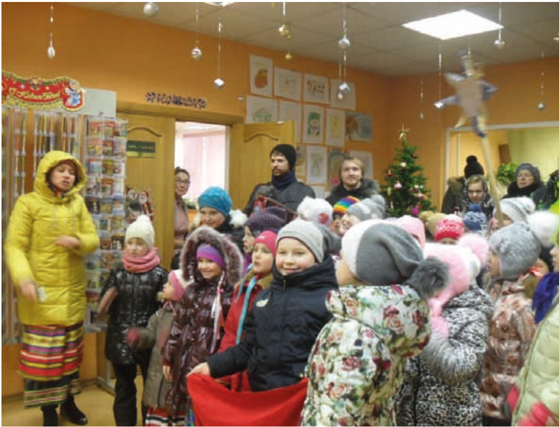
«Пришла Коляда, отворяй ворота»