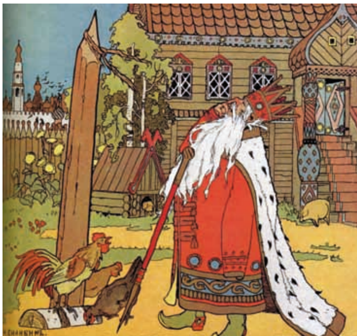
И.Я. Билибин. Иллюстрации к сказкам

Когда учащиеся получают задание по живописи выполнить пейзаж, они с увлечением занимаются этой работой. Они знают, что почти каждый пейзаж может быть использован как среда в жанровой композиции и выполняют большее количество работ, нежели было поручено. Для подготовки к сказочной теме очень помогают зарисовки, выполненные во время пленера. Так как помимо пейзажных зарисовок, дети много рисуют животных. В русских сказках часто главную роль играет одно или несколько животных. А во время пленера дети посещают зоопарк, зоологические музеи, где им предоставляется возможность порисовать как живых, так и обездвиженных животных и птиц. Необходимо заранее еще на уроках познакомить детей с анатомией животных и птиц, чтобы зарисовывая животных, ребята выполняли наброски более профессионально. Все наброски и зарисовки учащиеся используют для построения композиции на заданную тему.