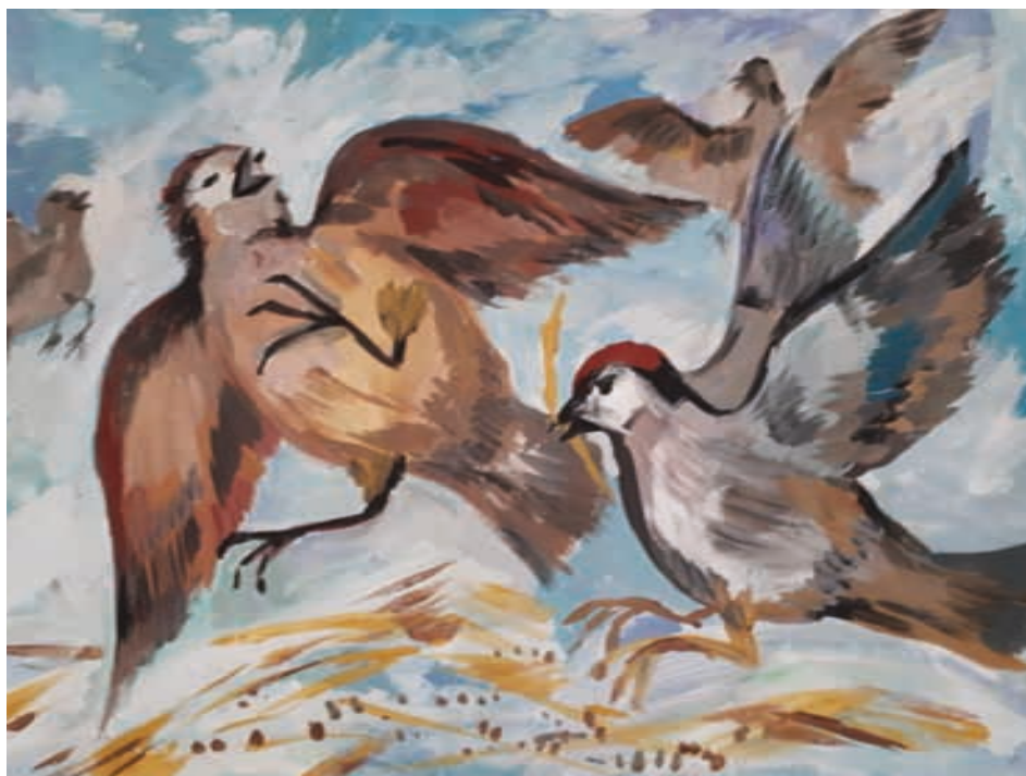
Шардин Тимофей По сюжету сказки «Три зёрнышка» Гуашь